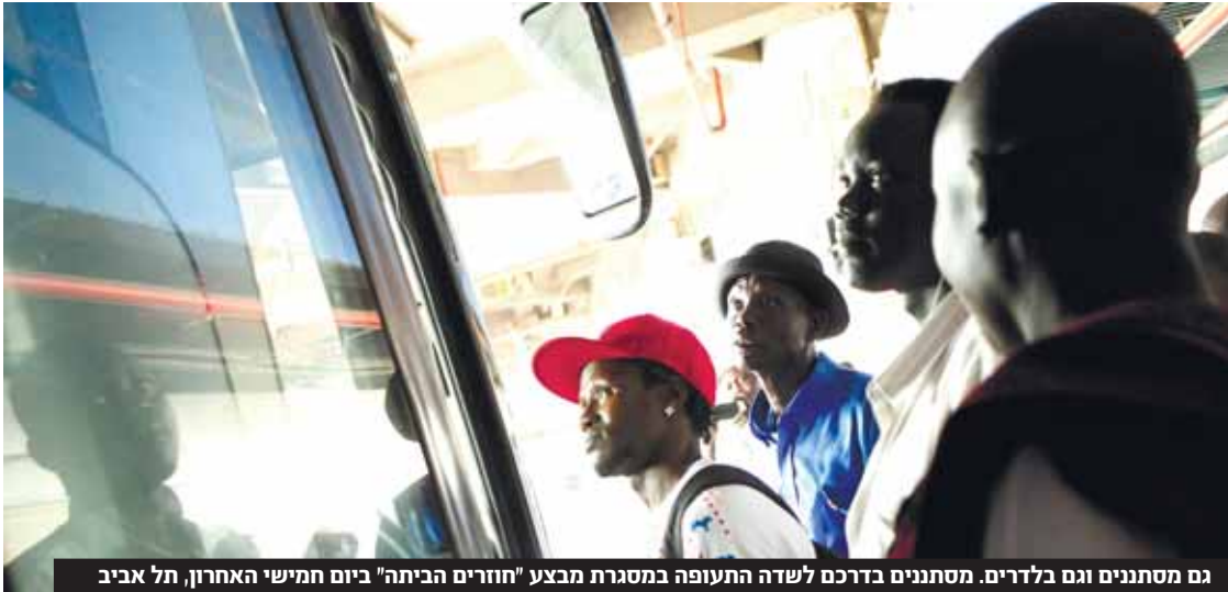
גם מסתתנים וגם בלדרים. מסתתנים בדרום לשה התעופה במסגרת מבצע "חוזרים הביתה" ביום חמישי האחרון, תל אביב והיקפה.

מאת י. בנדל שירות הבטחון הכללי והג'נטר חושדים כי ארגוני הטרור הפלסטיניים מפעילים רשת של הלבנת כספים באמצעות מדי גרים מאפריקה השולחים כסף לבני משפחותיהם – כך נחשף באישי"ש. ע"פ הדיווח, מדי שנה שולחים המהגרים מאות אלפי שקלים ממזרחותיהם שלא כחוק חוצה לארצם. בתחילת השבוע אישרה ועדת השרים לחקיקה הצעת חוק שגיבש משרד המשפטים האוסרת על מהגרים שנכנסו לארץ לפרש כחוק לשלוח כספים מישראל. מטרת החוק המוצע רת היא להפחית את התמריץ של אזרחים אפריקאים להגיע ירושלים. חוקרי השב"כ התחוקו אחר נתבי העברת הכספים והבינו כי הכספים אכן מגיעים לארגוני טרור. במעצרים נתפסו מוזרות בשותפן כ-50 אלף דולר בכל העברה, ומהחקירה עלה על העברות מתבצעות פעמים בשבוע בממוצע, בסדר גודל של 100-400 אלף שקל לחילוף. לרשות החוק ידוע על המישה ומעבירים את הכסף לפי הערך מדובר בכ-15 ש"ח הכל.