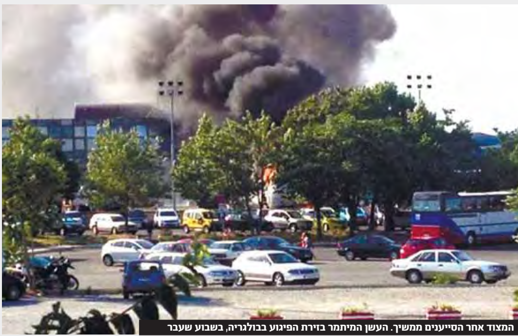
המצוד אחר הסייענים ממשיך. העשן המתמר בירת הפיגוע בבולגריה, בשבוע שעבר

המחבל ניסה להכניס לצעני את המטען של האוטובוס את תיק הנפץ תוך שהוא מזויז את התיקים של המטיילים ופתח פעימות עד 2 מהנוסעים ■ מעדידות נוספות עולה כי המחבל שהה במלון בוורנה, ניסה לשכור רכב ודיבר רוסית ■ רשת של סייענים שהתנה במדינה בחודש שקדם לפגיעו