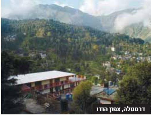
דרמסלה, צפון הודו

איבדה דם רב מה שהביא למותה. מאת אליעזר פרידמן ישראלית שטיילה בהודו נהרגה ממפולת סלעים שפי געה בה במהלך טיול באזור דרמסלה בצפון הודו. לפי הדיווחים, אחד הסלעים עים שפלו במפולת, פגע בה, ועד שהמטיילים האחרים הצליחו לפנות אותה ולהעביר אותה לטיפול רפואי היא קודמת.