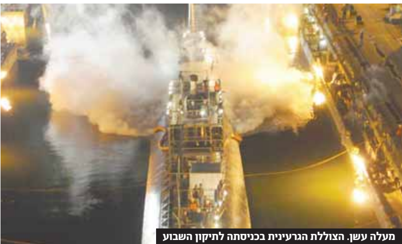
מעלה עשן. הצוללת הגרעינית בכניסתה לתיכון השבוע