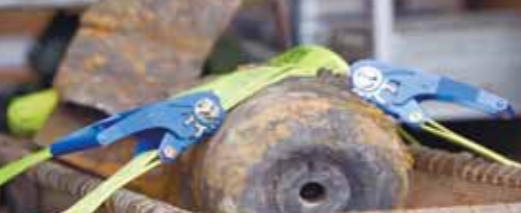
נוטרלה במקומה. הפצצה העתיקה שהתגלתה בברלין אתמול

כשעומסי התנועה נמשכים עוד שעות ארוכות. תחנת הרכבת המרכזית בברלין מוהוה עורק התחנה חשוב מאוד בגרמניה, ומדי יום עוברות בה למעלה מאלף רכבי תחנת הרכבת המרכזית בעיר.