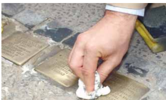
מגנים את האירוע "פעילים ממקים את המצבות שחוללו"

הקמת המצבות היתה חלק ממיזם מיוחד של ארגונים יהודיים יחד עם ממשלת גרמניה במטרה להנציח את מאות בתי הכנסת שהיו בגרמניה. טכס הנחת המצבות נערך ביום הראשון של חול המועד פסח (בחול' ו) וכבר למחרת הושחתו המצבות בצורה מזוי פירה. עיריית ברלין גינתה בתוקף את האירוע. דובר העירייה מסר