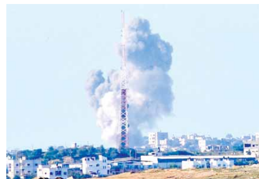
על כל ירי תגובת תגובה. תקיפת צה"ל ברצועה