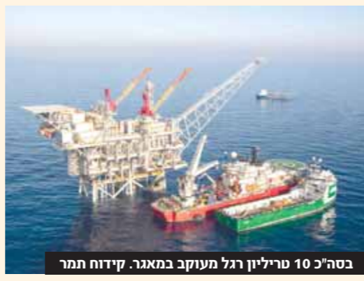
בסה"כ 10 טריליון רגל מעוקב במאגר. קידוח תמר

מנוססת על קידוחי פיתוח וניי תוח מתמשך שנעשו במאגר. על פי הדיווח של נובל, קצב הפקת הגז היומי ממאגר תמר עומד על כ-300 מיליון רגל מעוקב, כאשר היעד הוא להגיע לשיא של מיליארד רגל ביום לקראת סוף 2013.