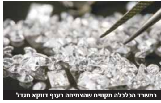
במשרד הכלכלה מקווים שהצמיחה בענף דווקא תגדל.