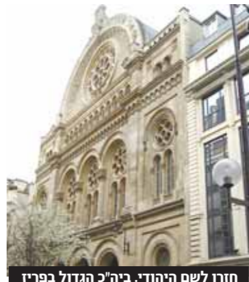
חזרו לשם היהודי. ביה"כ הגדול בפריז

את העתירה הגישו שתי משפחות יהודיות שנאלצו לשנות את שמותיהם בשנות השואה מוחשש לחייהן