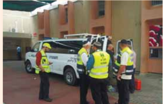
חוקרי המשטרה בבית הספר באלפי מנישה

נער כבן 15 נפל ביום שישי מגג בית הספר בישוב אלפי מנישה ונהרג. גיל ביסמוט פוקד זק"א ש"י, אמר כי 'קיבלנו דיווח ממורה ק"א על פצע קשה מנפילה מגובה כחצר בית הספר, אני ביחד עם צוות מתנדבים כשהגענו למקום הנער היה ללא רוח חיים כתוצאה מנפילה מגג בית הספר. רופא של מד"א אישר את מותו בתוקם. מתנדבי זק"א ש"י טיפלו בגופת הנער ובאיסוף הממצאים"'. ‏