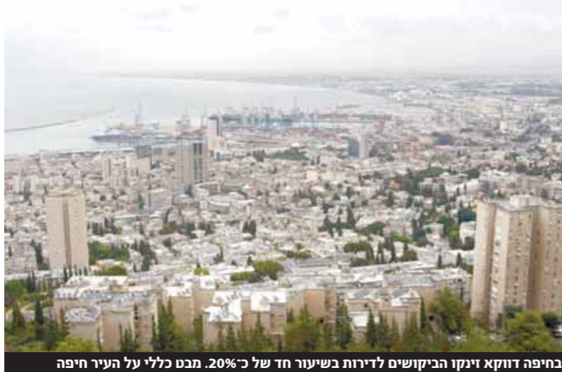
בחיפה דווקא זינק הביקושים לדירות בשיעור חד של כ-20%. מבט כללי על העיר חיפה

בעוד הגישה אובאמה נוסה ללא הצלחה להביא את הקונגרס לבצע חקיקה נרחבת בנושא, פועלים נגדו המפלגה הרפובליקנית ובעיקר איגוד הרובאים האומי ארודות והציון העומד מאחורי התקון השני לחוקה האמריקנית. בעוד הגישה אובאמה נוסה ללא הצלחה להביא את הקונגרס לבצע חקיקה נרחבת בנושא, פועלים נגדו המפלגה הרפובליקנית ובעיקר איגוד הרובאים האומי ארודות והציון העומד מאחורי התקון השני לחוקה האמריקנית.