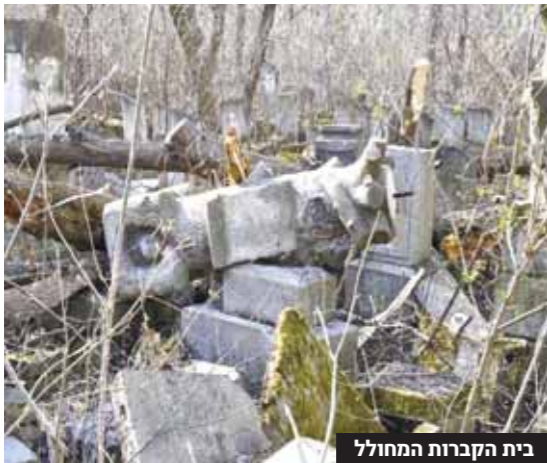
בית הקברות המחולל