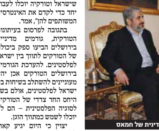
האם ארדואן יוכל לשמש כמתווך? ארדואן עם ראש הלשכה המדינית של המאס